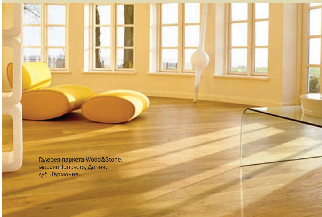
Галерея паркета Wood&Stone, массив Junckers, Дания, дуб «Гармония».

Уникальным представителем паркетного мира является коллекция Antica Venezia итальянской фабрики Garbelotto. У нее нет аналогов. Дело в том, что при реконструкции Венеции из воды начали извлекать сотни и тысячи старинных свай. И если подводные ярусы этих столбов отслужили свой срок, то надводные части, простоявшие на ветру 600–700 лет, обрели особую прочность. Из них предприимчивые итальянцы и начали делать паркет. Следы гвоздей, дырочки от жучков, зернистая текстура и отметины сучков придают венецианскому паркету исключительный шарм.