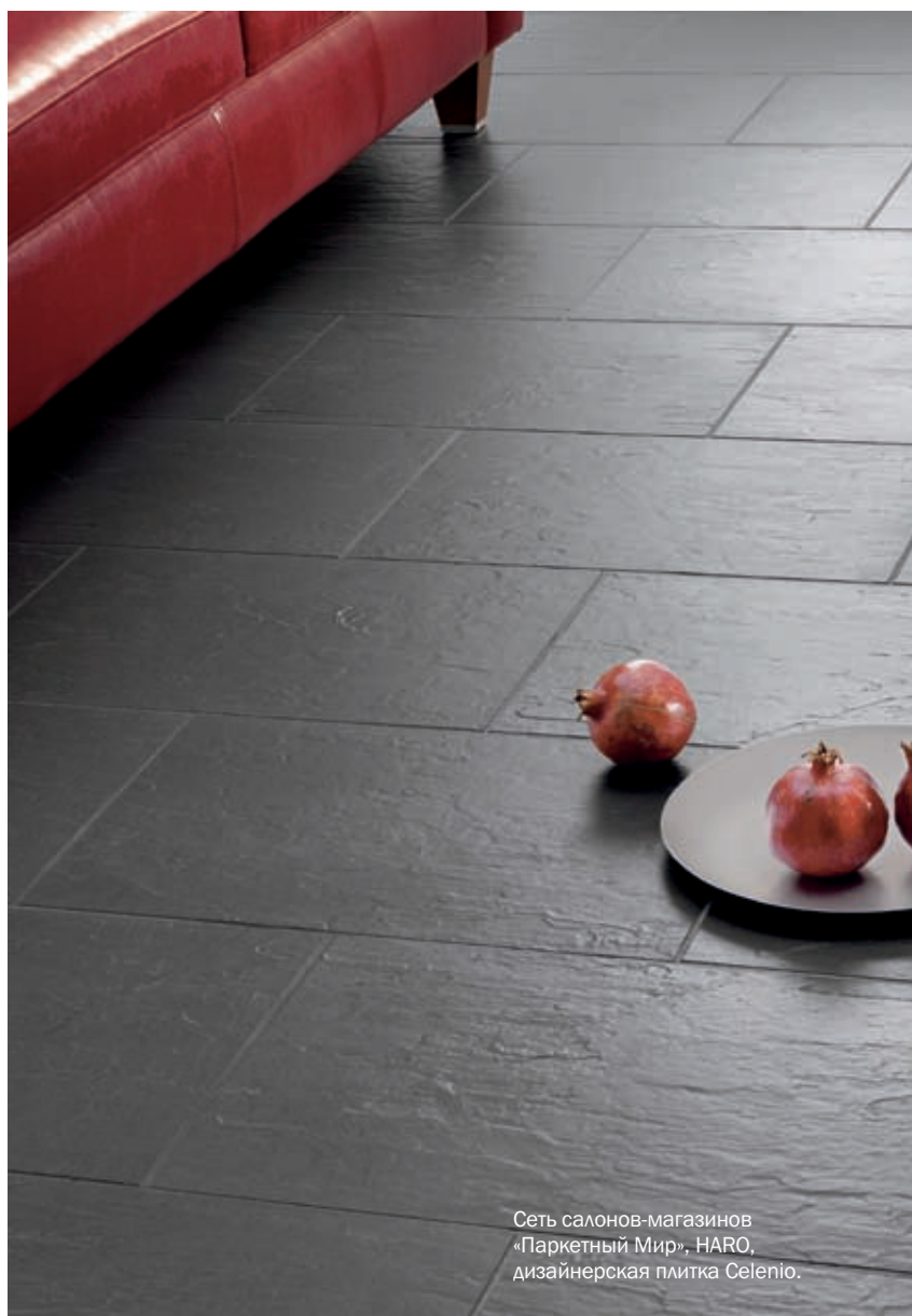
Сеть салонов-магазинов «Паркетный Мир», HARO, дизайнерская плитка Celenio.

С недавних пор семейство паркета пополнилось бамбуком. И хотя бамбук формально не является деревом, а относится к злаковым растениям, в натуральности ему не откажешь. Естественный золотисто-соломенный цвет, перемежаясь в местах нахождения узлов стебля темными поперечными полосками, вызывает положительные эмоции. По прочности покрытие немного уступает традиционному паркету, но