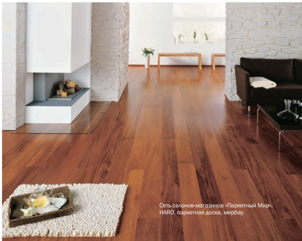
Сеть салонов-магазинов «Паркетный Мир», HARO, паркетная доска, мербау.

Дуссия – «дитя» африканских тропиков – тоже отлично справляется со всеми внешними воздействиями. Цвет – от соблазнительной солнечной желтизны до нарядных красно-коричневых оттенков. Еще один популярный «экзот» – мербау. Паркет из этой породы получается очень живописным, тон красной охры с коричневыми и желтоватыми прожилками выглядит чрезвычайно эффектно.