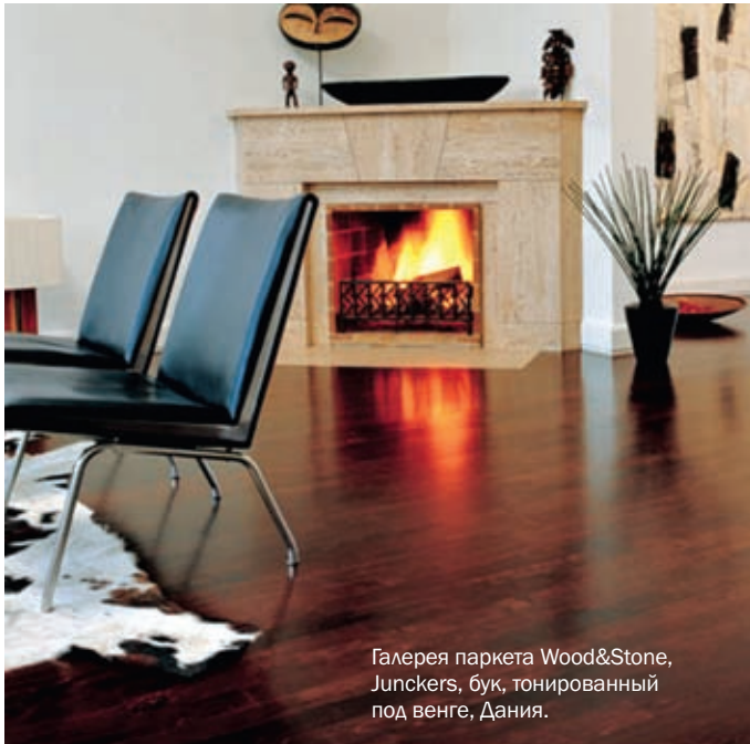
Галерея паркета Wood&Stone, Jupskers, бук, тонированный под венге, Дания.

холодов предпочтение отдается паркету светлых солнечных оттенков. В любом случае подходящий вариант можно найти всегда.